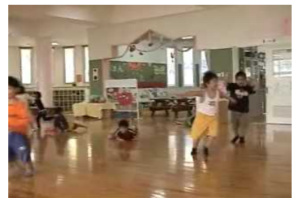
写真1 タンクトップの男児

幼稚園教育の基本である環境を通して行う教育は、幼児の主体性と教師の意図がバランスよく絡み合って成り立つものである。教師主導の一方的な保育の展開ではなく、一人ひとりの幼児が教師の援助の下で主体性を発揮して活動を展開していかなければならない。事例を通して、子ども達をよく理解した上で指導計画を立てる事が大切であり、常に幼児の実態や育ちと照らし合わせて検討し直しながら保育を進めていく事が重要である事が分かった。