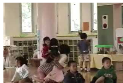
写真2 退屈そうな子ども達