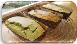
☆ 調理実習 ☆