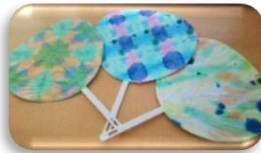
☆ 制作活動 ☆