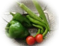
☆ 栽培 ☆